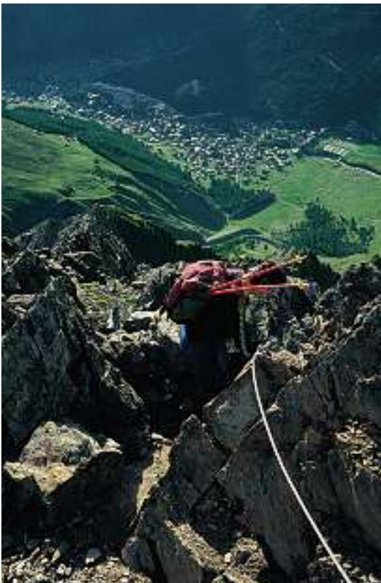
Über diesen steilen, ausgesetzten Felsgrat führt der neue Weg vom Oberen Distelhorn zu den Mischabelhütten. Über 1000 Meter tiefer liegt Saas Fee.